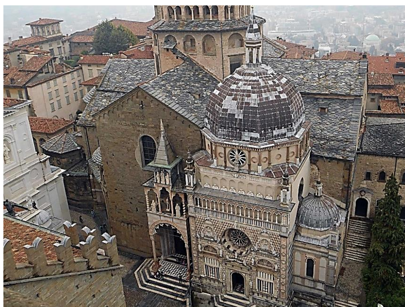
Basilica Santa Maria Maggiore med Bartolomeo Colleonis kapel som 'facade'. Katedralen S. Alessandro skimtes til venstre.